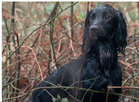
FTCh Tiptopjack Twirl