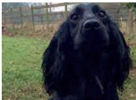
FTCh Tiptopjack Ajay