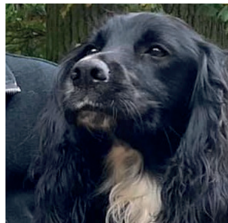
Int. FTCh Tiptopjack Firebug, Irsk Cocker Championshipvinder 2021 og nr. 3 på Engelsk Cocker Championship 2022.