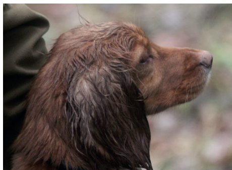
FTCh Tiptopjack Swirl