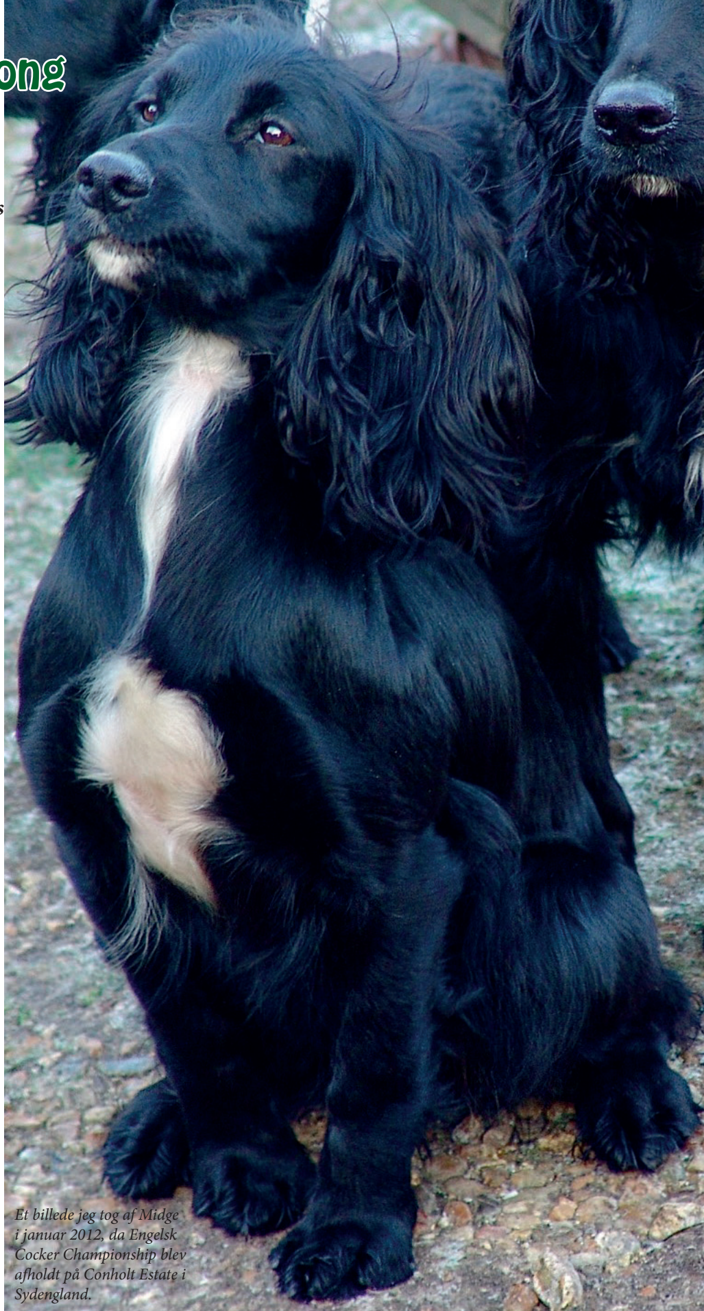
Et billede jeg tog af Midge i januar 2012, da Engelsk Cocker Championship blev afholdt på Conholt Estate i Sydengland.