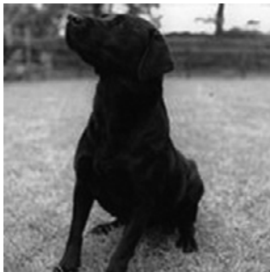
En af de meget kendte "børn" efter Leacross Rinkals, tæven F.T.Ch. Glenbriar Skippy .

F.T.Ch. Glenbriar Skippy , er en anden tæve efter