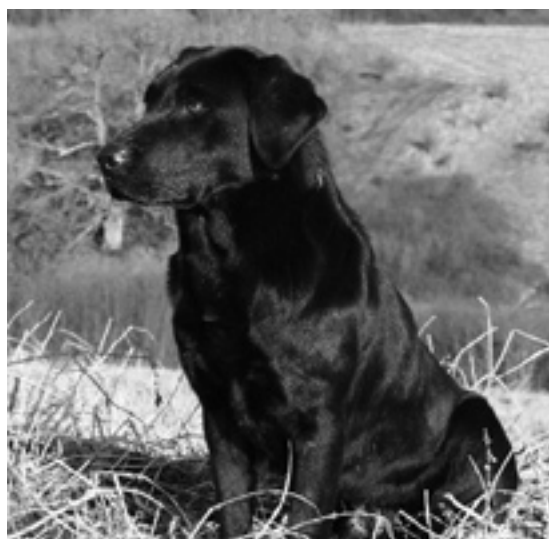
F.T.Ch. Tasco Alexander Beetle