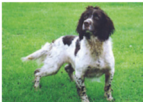
F.T.Ch. Misselschalke Lad of Halaze