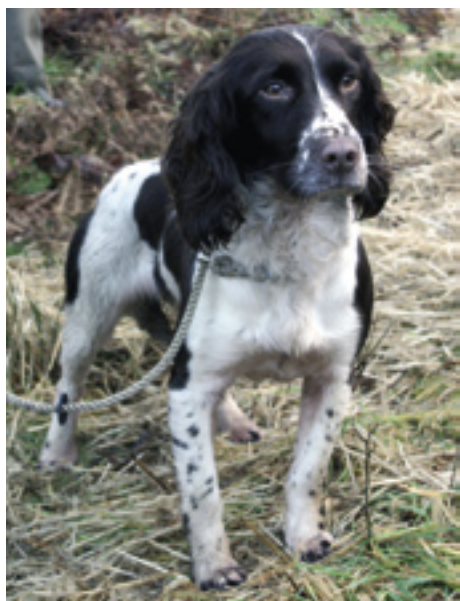
Engelsk og Irsk Championshipvinder, F.T.Ch. Annickview Anna.