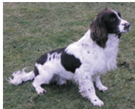
S.F.T.Ch. Lisgarvagh Gold af Flora som også har vundet en vinderklasse i Danmark.