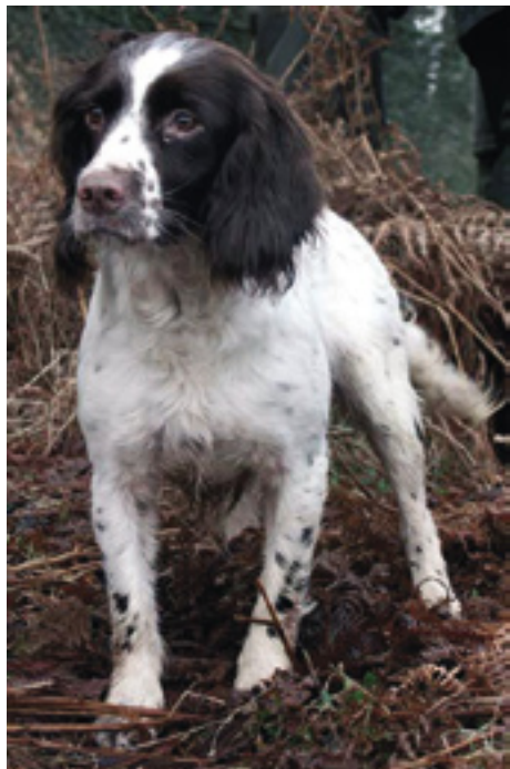
F.T.Ch. Steadroc Serenade, kuldsøster til Sam og en anden meget fremtrædende tæve på de britiske øer.