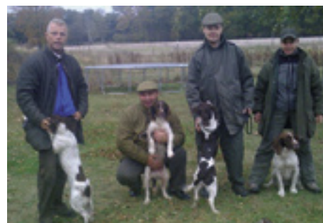
Det berømte Gosforth kuld her i DK. Fra venstre: DK.F.T.Ch. Chaser Gosforth Gail, DK.F.T.Ch. Chaser Gosforth Gypsy af Meadows, DK.F.T.Ch. S.F.T.Ch. Chaser Gosforth Glow af Sweepstake og F.T.W. Chaser Gosforth Gaffer af Meulengrath.