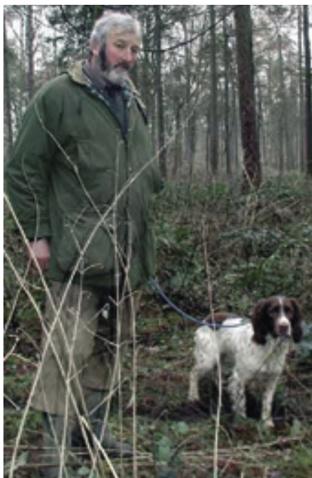
F.T.Ch. Steadroc Acher of Flintwood en anden champion efter Chilview Ann of Steadroc, men med en anden far end Sam.