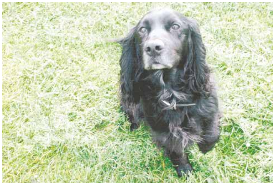
FTCh Fenlord Sioux Raider