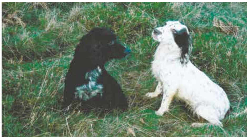
2 af Robins FT vindende tæver. Til venstre FTW Fenlord Gypsy Beaut (4. vinder Cocker Championship 2000 og til højre FTW Fenlord Razzle