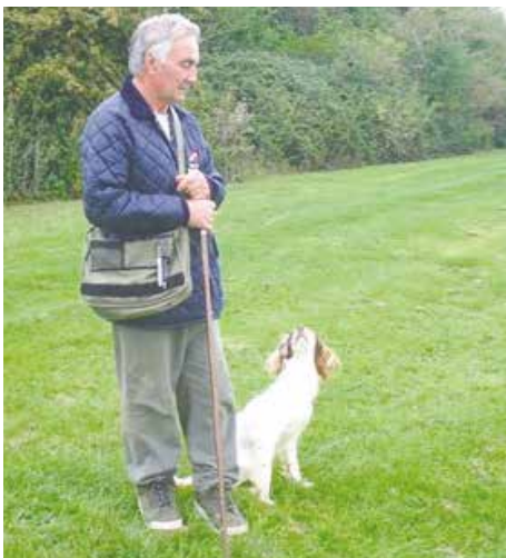
En Springertæve Robin forventer sig rigtig meget af, dansk opdrættede, Kikaro Rubi

komme gennem nåleøjet til championship-pet, der som bekendt kræver en 1. vinder i vinderklassen.