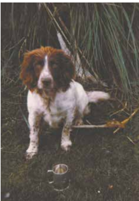
Robins første avlstæve, FTW Lady Heidi of Fenlord.