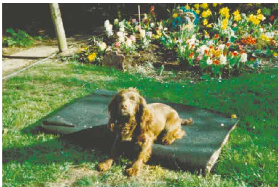
FTCh Fenlord Thunder