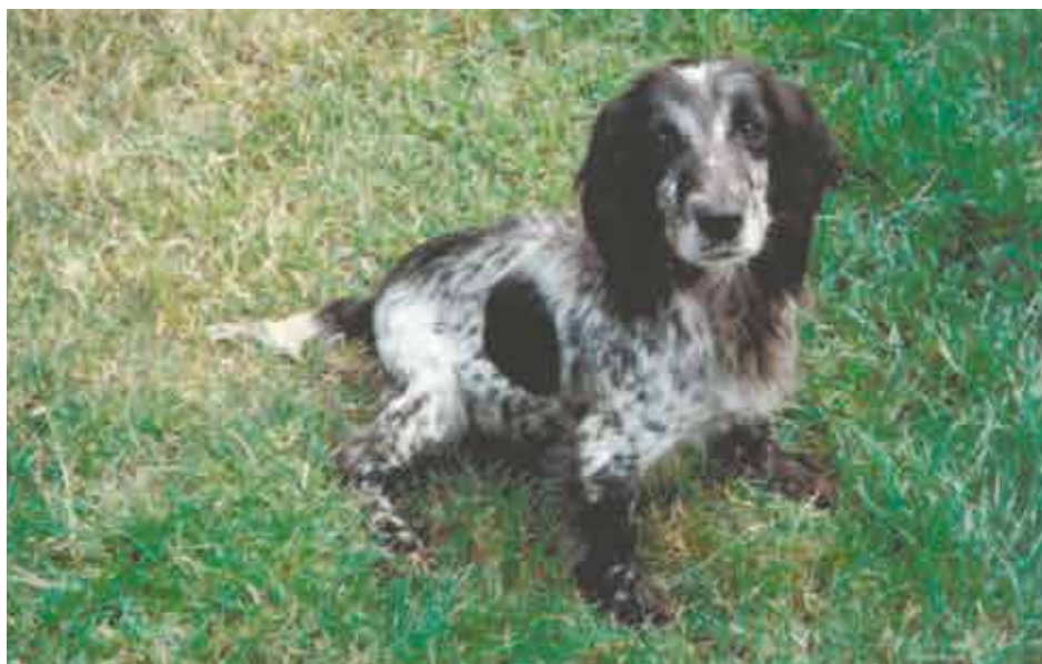
Stammor til Fenlord Cockerne og Robins første champion blandt Cockerne, FTCh Gypsy Bonnie of Fenlord

Robins næste generation af Cockere, blev et kuld hvalpe på tæven FTW Fenlord Razzle. Efter Razzle selv, var tæt linieavl på Robins