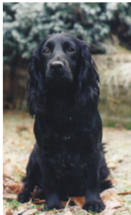
DK.F.T.Ch. Whitlochs Damselly af Go Get It.