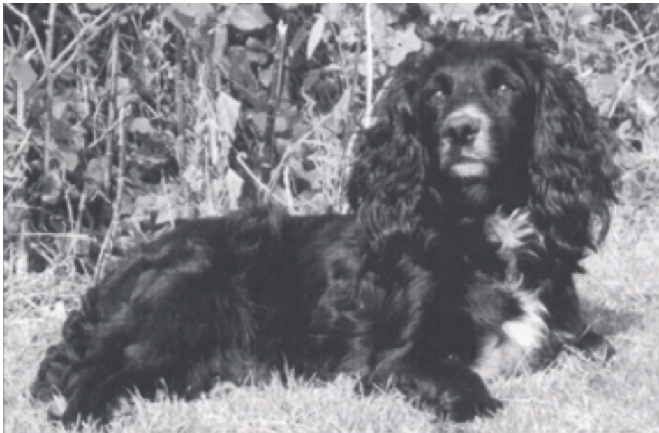
Tæven F.T.Ch. Wernffrwd Silk, som gennem 2 parringer med F.T.Ch. Maesydderwen Kestrel, har præget avlen af Cockere i nærmest uhyggelig grad.

af Will Clulee, og han er samtidig blevet far til 2 F.T.Ch., nemlig Maesydderwen Scimitar og Cheweky Bovril. Scimitar har indenfor de sidste 2 år, været den hanhund som har haft flest afkom kvalificeret til det engelske Cocker Championship, og det er samtidig meget bemærkelsesværdigt, at netop Scimitar er resultatet af nærmest indavl på Maesydderwen Kestrel, idet hans mor var F.T.Ch. Wernffrwd Kathleen, som også er en datter efter Kestrel. Scimitar er altså resultatet af en halvsøskende parring.