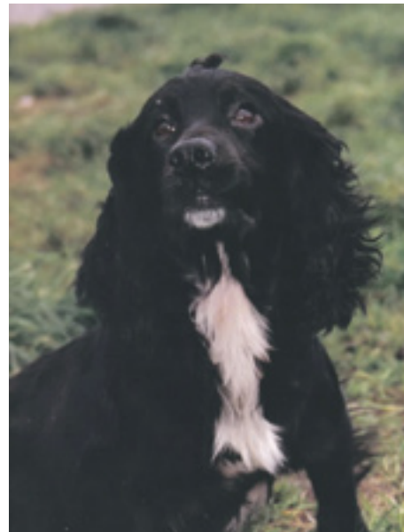
F.T.Ch. Wernffrwd Siarl