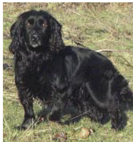
F.T.Ch. Larford Cateran