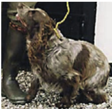
DK.F.T.Ch. Kirkstall Lock