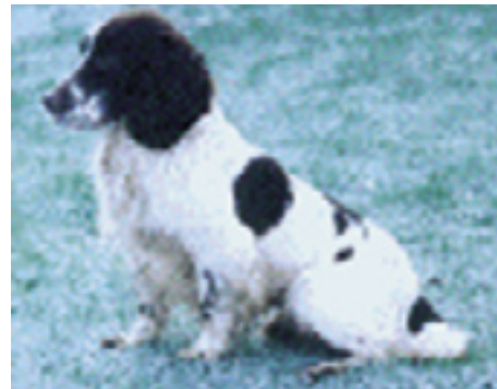
F.T.Ch. Blindwell Beau