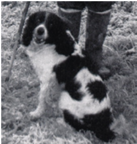
Springerhannet F.T.Ch. Readhead Riley