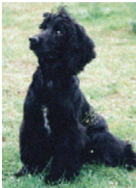
F.T.Ch. Kelmscott Swoop - Cocker Championshipvinder 2001.