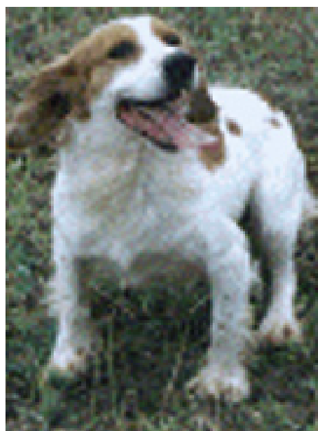
F.T.Ch. Jasper of Parkbreck - Cocker Championshipvinder 1992.