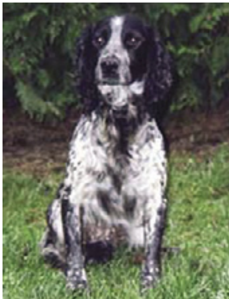
DK.F.T.Ch. Jagtcocker Enna of Ravenhill,