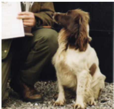
DK.F.T.Ch. Renweth Madonna af Muninn