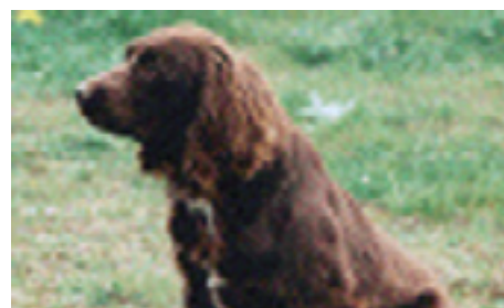
F.T.Ch. Kelmscott Foxie Girl