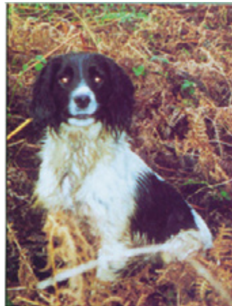
F.T.Ch. Parkbreck Achieve of Dearneside

Badgercourt Moss blev en helt enestående hund for Carl, og Moss blev selvfølgelig meget hurtig F.T.Ch., men det der først og fremmest gjorde Moss til en unik hund, var, at han kunne gøre sig gældende gennem rigtig mange sæsonen, og han afsluttede