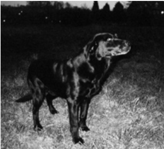
F.T.Ch. Pocklea Remus som gammel hund.

kom derfor med til Danmark. Reed var også et stort talent, og han nåede at vinde en markprøve og også at blive far til et par kuld hvalpe her i Danmark. Det viste sig dog, at Reed havde nogle højst uønskede temperamentsproblemer, som gjorde, at han blev solgt som almindelig jagthund inden han var 3 år, hvorfor han ikke nåede at sætte sit præg på avlen her i Danmark.