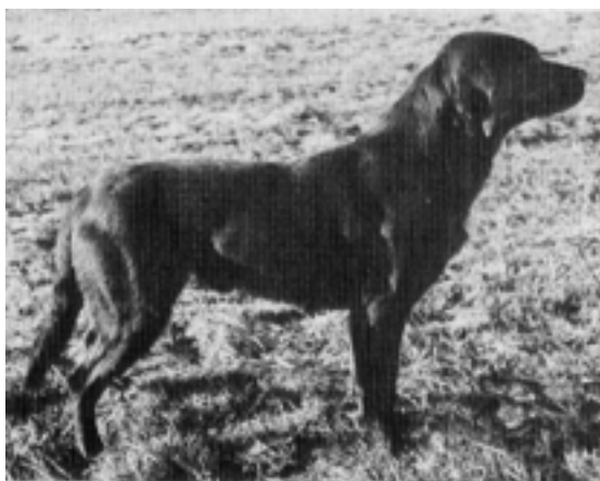
F.T.Ch. og Championshipvinder 1981 Pocklington Glen.