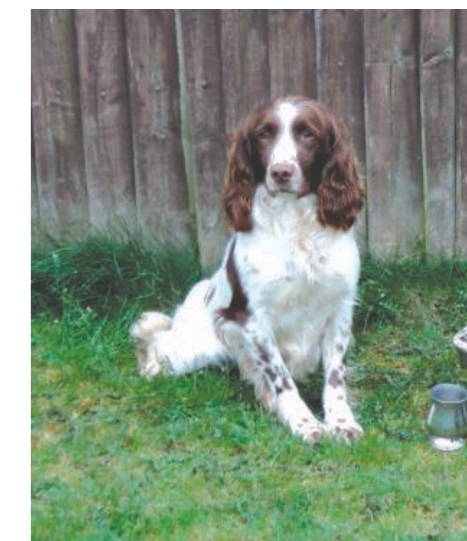
FTCh Helmsway Henry, søn af Holly og efter manges mening en af fremtidens absolutte avlstjerner.