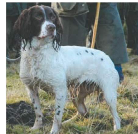
FTCh Craighaar Charisma stammor på kennel Helmsway

haft, må man forvente, at der er endnu flere superhunde på vej fra dette lille men enormt succesrige opdræt.