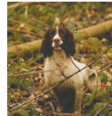
FTCh Helmsway Hawk of Witchwillow, kuldbroder til Honey og Holly og meget benyttet avlshan.