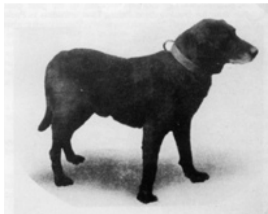
Buccleuch Avon (født 1885) regnes i dag for værende stamfaderen til alle Labradors.

Peter of Faskally blev ligeledes den første avlsmata-