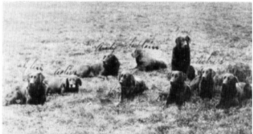
Et gruppebillede af Buccleuch labradors. Billedet er formodentligt fra ca. 1912.

2. verdenskrig samt især udbruddet af hundesyge i England i 1948 gjorde dog, at næsten alle kennel-