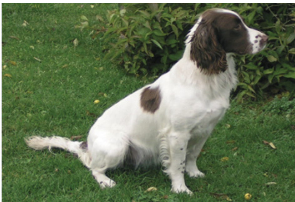
DK.F.T.Ch. Birdrowe Diamond af Flora. 9 x 1. vinder i vinderklassen samt årets mest vindende marprøvehund i 2009 og 2010.