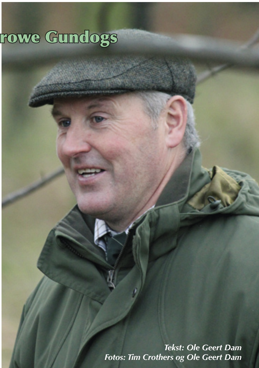
Tekst: Ole Geert Dam

Interessen for markprøver, begyndte først at blomstre i 1979, da Tim, som tilskuer, overværede det første Game Fair nogensinde i Nordirland, nemlig på Glandeboy Estate, hvor der samtidig blev afholdt en international Working Test for Spaniels. Denne begivenhed gjorde, at Tim blev inter-