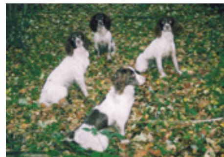
Berømte Birdrowe hunde, fra venstre Birdrowe Rosie, F.T.Ch. Cressett Melody of Birdrowe, Ir.F.T.Ch. Cressett Claret of Birdrowe og Int.F.T.Ch. Birdrowe Miss O'Lene.