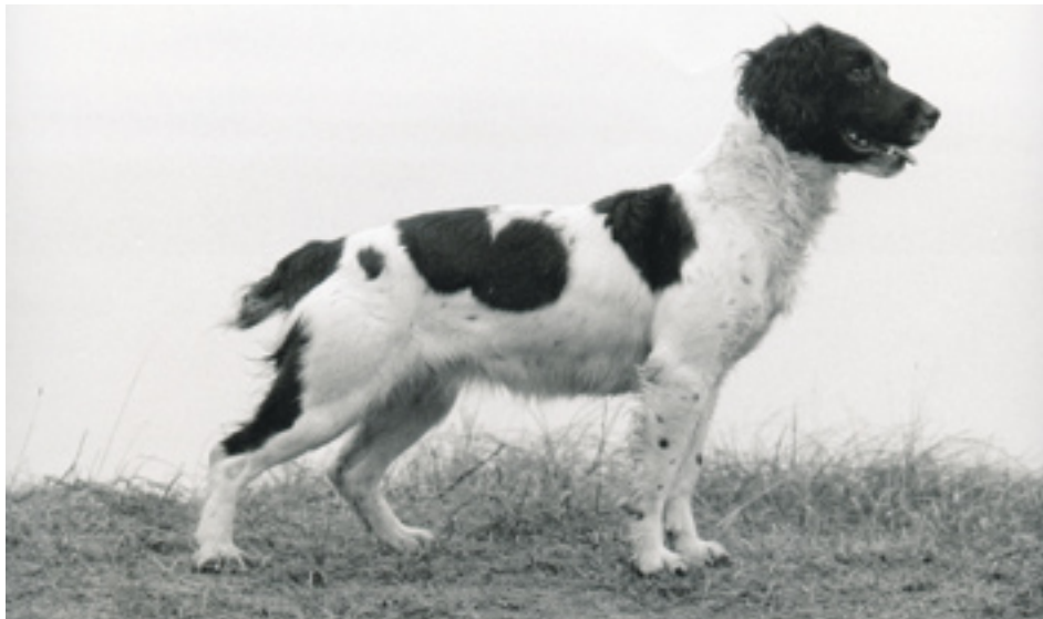
DK.F.T.Ch. Birdrowe Shauna af Brookmoor. Den mest vindende Springer i Danmark nogensinde.

Foruden ovennævnte Birdrowe Buzz of Bellever (som aldrig blev ført i Dk), har vi haft yderligere 3 importere fra Kennel Birdrowe her i Danmark, og især 2 af disse 3 importere har været umådelige succesrige her i DK.