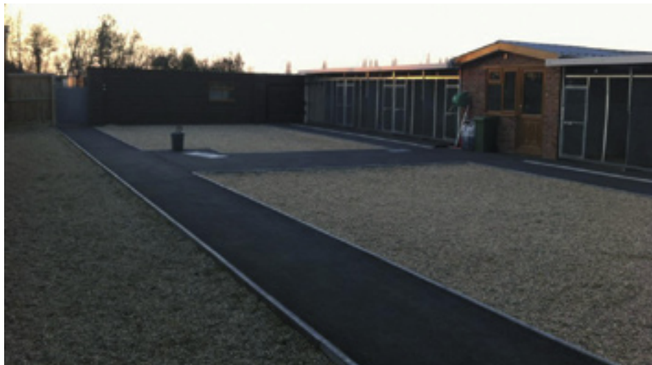
Totalt nyrenoverede kennel faciliteter på the Ledbury Lodge.