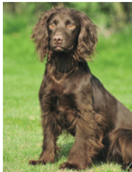
F.T.Ch. Heolybwllch Fatty