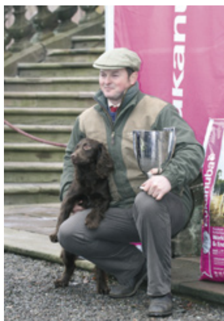
Starten på hele succesen, vinder af The English Cocker Championship januar 2011.