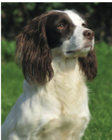
F.T.Ch. Beggarbush Poppit, datter af Setlands.

kan blive far til, men på trods af, at Setlands kun blev mor til 36 hvalpe, fordelt på 5 kuld hvalpe, har hun vist sig at være en formidabel avlstæve, hvor hun har formået at producere tophunde i alle sine 5 kuld, som i øvrigt har 4 forskellige hanner som far.