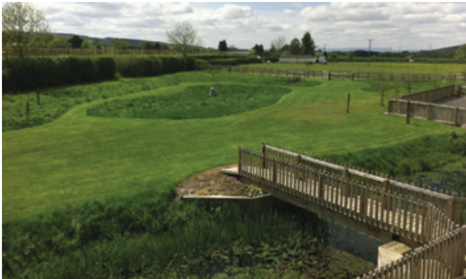
Man skal lede længe efter flottere og bedre træningsfaciliteter end på Ledbury/Beggargbush kennelen.