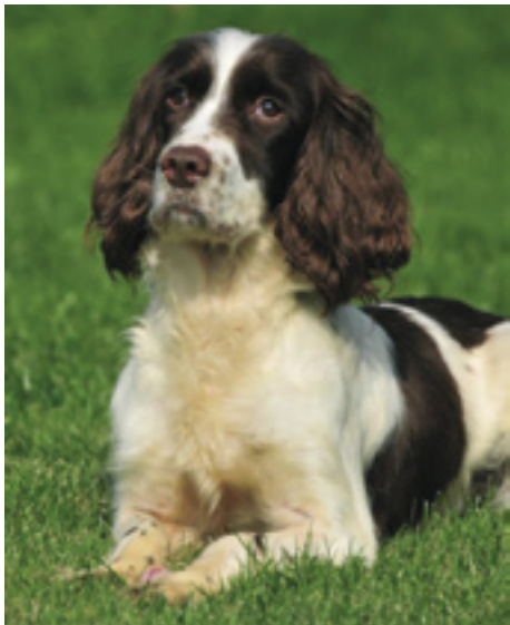
F.T.Ch. Steadroc Setlands of Beggarbush, stammor blandt Bens Springere.