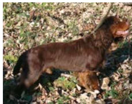
FTCh Gournaycourt Ginger