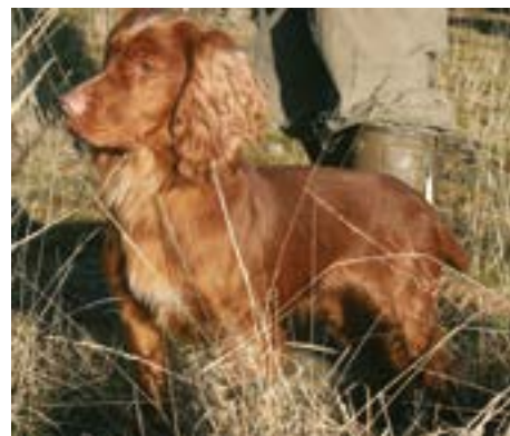
FTCh Chyknell Gold Star