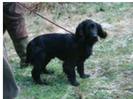
FTCh Mallowdale Zander