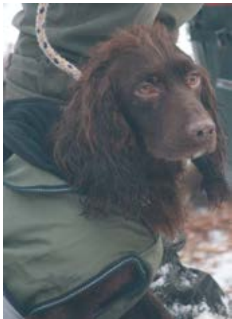
FTCh Moelfamau Griffon