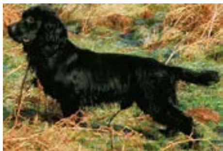
FTCh Maesydderwen Scimitar