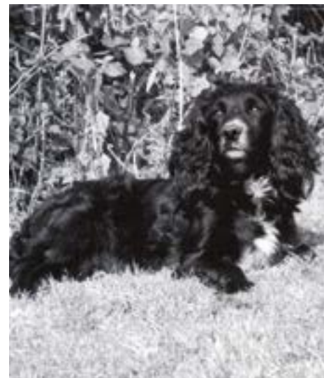
De 2 parringer mellem FTCh Maesydderwen Kestrel (til venstre) og FTCh Wernffrwd Silk (til højre) er stort set hele baggrunden for Cockerne kvalitet i dag.