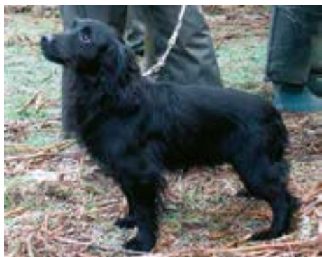
FTCh Sandford Black Mamba

sine egenskaber videre, og det er sådanne egenskaber der er grundlaget for, at man kan kaldes avlsmatador.