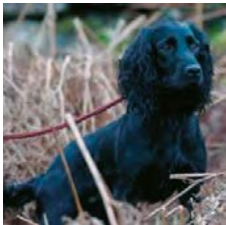
FTCh Dardnell Dealer