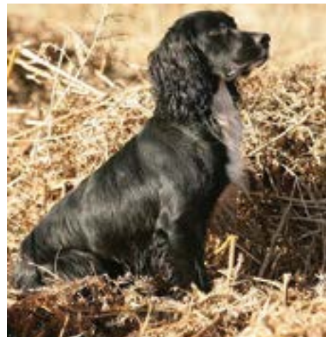
FTCh Mallowdale Gun