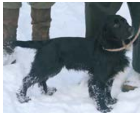
FTCh Tudorbriar Moonwarrior

Fremtiden blive spændende at følge, især om Cockerne kan lægge yderligere til den meget høje kvalitet de lige nu er i besiddelse af eller om de igen falder i kvalitet. Jeg har her givet nogle eksemplar på hvilke retninger der indikere, man skal gå, for at bevare de kvaliteter vi lige nu kan glæde os over både på jagt og markprøver.