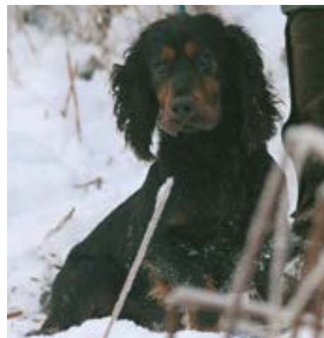
FTCh Lockslane Archibald