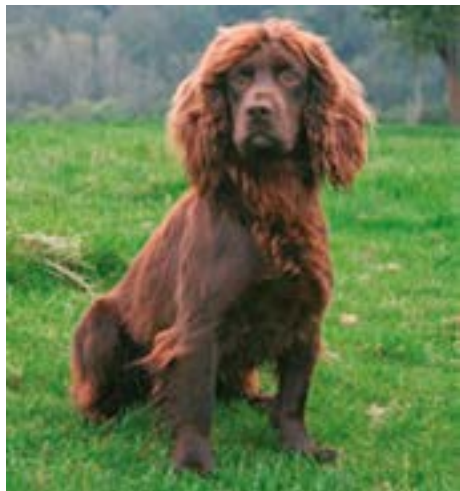
FTCh Argyll Warrior