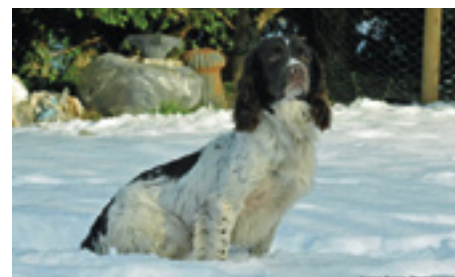
Cowarnecourt Gaffer of Edgegrove