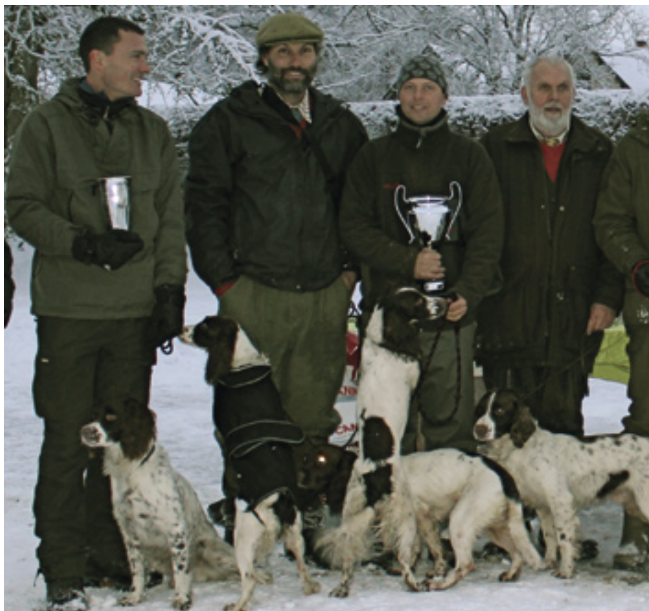
Dansk Mesterskab 2012. Nr. 1, 2 og 3 er alle børn efter Art. 4. vinderen et barnebarn.

Art blev født den 14. juni 1995, og grundla-