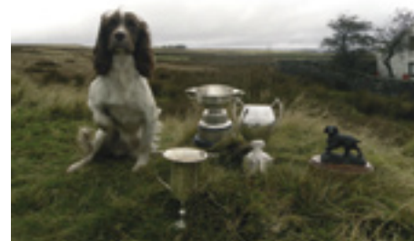
F.T.Ch. Flaxdale Jamie