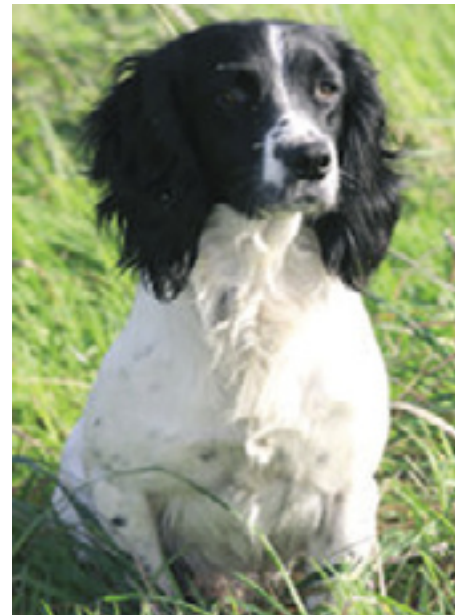
F.T.Ch. Clearmeadow Flash of Countryways

"Only time will tell" men ingen tvivl om, at det bliver spændende at følge udviklingen de kommende år, hvor vi vil se rigtig mange hunde på markprøver efter vidt forskellige hanhunde, og ingen tvivl om, at der i løbet af 2-3 år vil blive fundet en ny avlsmatador, som vil suge mange parringer til sig.