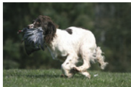
F.T.Ch. Annickview Breeze - datter af Edwardiana Tweed.