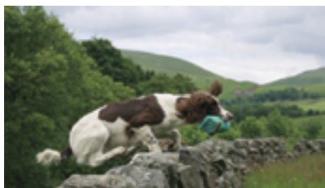
F.T.Ch. Buccleuch Isla - datter af Annickview Anna.