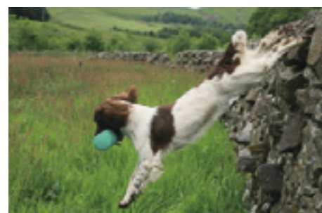
F.T.Ch. Buccleuch Charm - datter af F.T.Ch. Toonarmy Top-Tip.