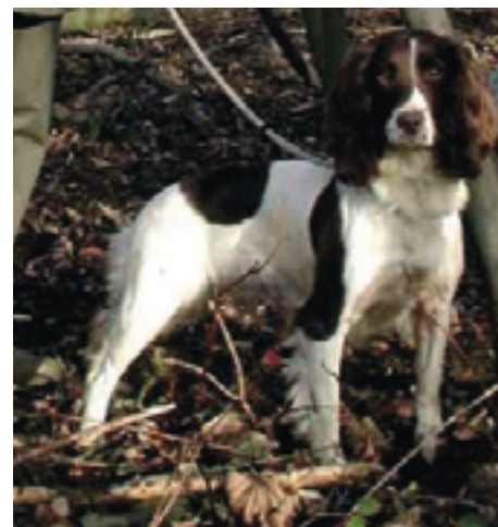
F.T.Ch. Toonarmy Top-Tip