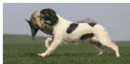
F.T.Ch. Annickview Challenger - datter af Edwardiana Tweed.

blevet mor til 4 markante F.T.Ch., og hvad der understreger hendes fremragende avlsegenskaber er, at disse 4 champions er med 4 forskellige hanhunde som far.