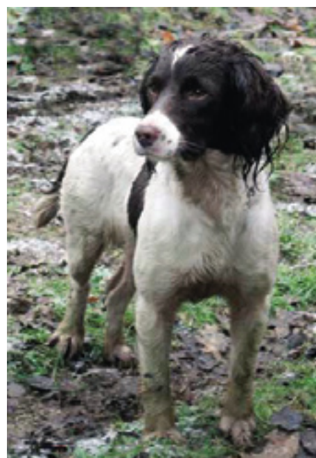
F.T.Ch. Edwardiana Tweed.