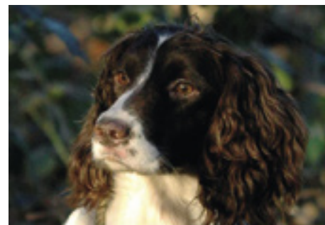
F.T.Ch. Edwardiana Terrasway.