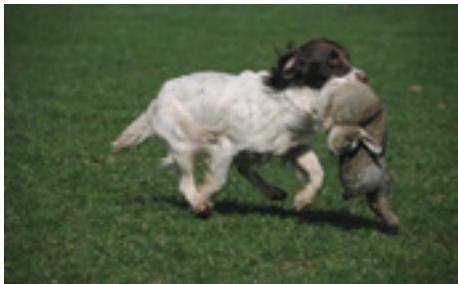
F.T.Ch. Buccleuch Lexie - datter af F.T.Ch. Annickview Breeze