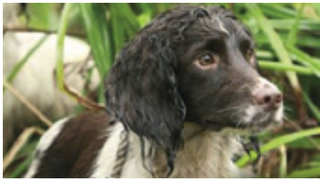
F.T.Ch. Buccleuch Jazz - datter af F.T.Ch. Annickview Breeze - 3. generation af championshipvindere.