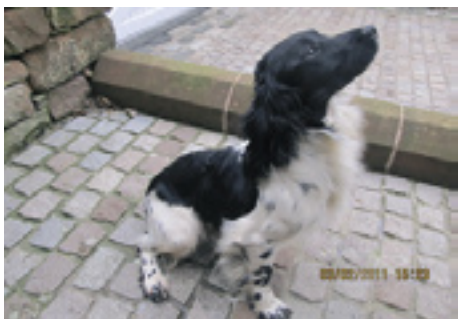
F.T.Ch. Buccleuch Pepper - søn af F.T.Ch. Annickview Breeze

dtil videre F.T.Ch. Buccleuch Jazz, som gentog sin mors succes ved at vinde det Engelske A.V. Championship i 2010. Jazz havde en fantastisk start på sin markprøvekarriere, idet hun blev champion efter kun 3 markprøver. Hun vandt sin første åben klasse markprøve, og kvalificerede sig derved til vinderklassen, og i vinderklassen vandt hun ligeledes de 2 første markprøver hun deltog på. Bedre kan det simpelthen ikke gøres.