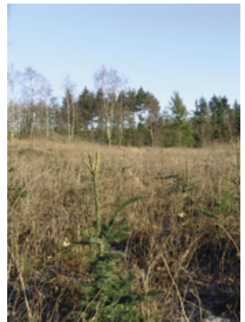
F.T. Spaniel & Jæger jan. 2010 25

Vi har haft 15-20 fasaner og 6 snepper på vingerne, stødt 1 ræv og set rigtigt meget råvildt. Vejret har samtidig været pragtfuldt, hundene har arbejdet fortrinligt så hvad mere kan man forlange? - Jo måske var der lige noget med nogle snepper!!!!